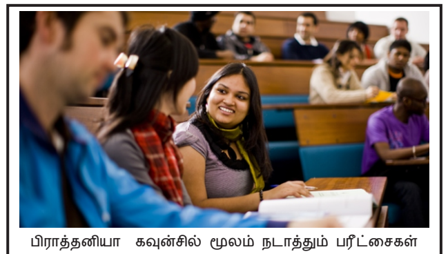
பிராத்தனியா கவுன்சில் மூலம் நடாத்தும் பரீட்சைகள்