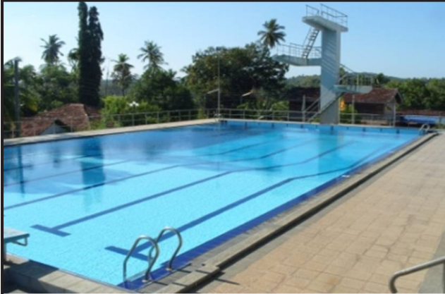
பெளிஅத்த சுழியோட்டத் தடாகம்

பெளிஅத்த தொழிநுட்ப கல்லூரி மற்றும் விரகெட்டிய இராஜபகூடி மத்திய மகா வித்தியாலத்தின் நீச்சற் தடாகங்களின்நிர்வாக மற்றும் பராமரிப்புச் செயற்பாடு மட்டும் ௨00௮.0௮.0௭ யிலிருந்து சுகததாச அதிகார சபையினால் செயற்படுத்தி இருப்பினும் இந் நீச்சற் தடாகங்களின் உரிமைசுகததாச அதிகார சபையிக்கு உரியதல்ல. சுற்றுப்புற வாழ்கின்ற முதியோர் மற்றும் பாடசாலை மாணவ மாணவிகளுக்காக நீச்சற் பயிற்சிச்