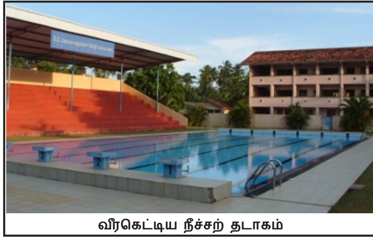
வீரகெட்டிய நீச்சற் தடாகம்

செயற்பாட்டிற்கான வசதிகளை அளிப்பது சுகததாச தேசிய விளையாட்டு தொகுதி அதிகார சபை மூலம் செயற்படுத்தப்படும்.