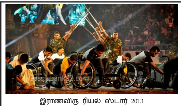
இராணவிரு ரியல் ஸ்டார் 2013