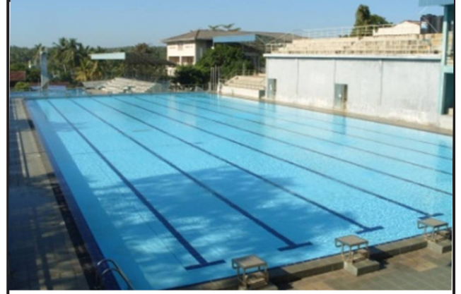
பெளிஅத்த பிரதான சுழியோட்டத் தடாகம்