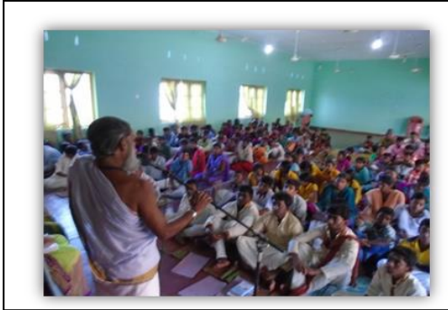
நாவற்குடா இந்து கலாசார மண்டபத்தில் நடைபெற்ற அறநெறி ஆசிரியர்களுக்கான வதிவிட கற்பித்தல் முறைக் கருத்தரங்கு