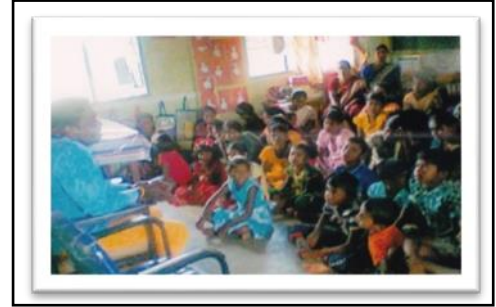
15.03.2015 இல் மன்னார் ஆண்டாங்குளம் பிள்ளையார் ஆலயத்தில் நடைபெற்ற சமய சொற்பொழிவு