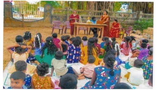
பொத்துவில்லில் நடைபெற்ற கண்ணப்ப நாயனார் குருபூசை