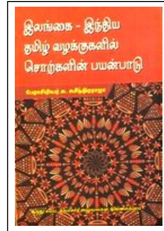
இலங்கை, இந்திய தமிழ்ச் சொல் வழக்கு நூல்