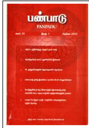
“பண்பாடு” இதழ் I