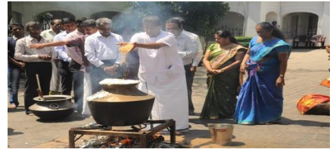
இவ்வாண்டு திணைக்களத்தின் அநுசரணையுடன் கொழும்பு 13, ஸ்ரீ பொன்னம்பலம் வாணேஸ்வரர் ஆலயத்தில் நடைபெற்ற புதுவருட்பிறப்பு விழா