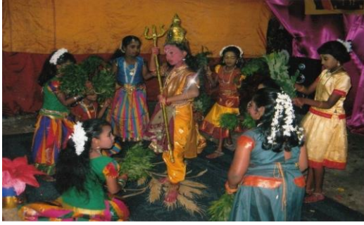
கண்டி நித்தவலை ஸ்ரீ முத்துமாரியம்மன ஆலயத்தில் நடைபெற்ற மகா சிவராத்திரி விழாவில் அறநெறி மாணவர்களால் நிகழ்த்தப்பட்ட கலை நிகழ்வு