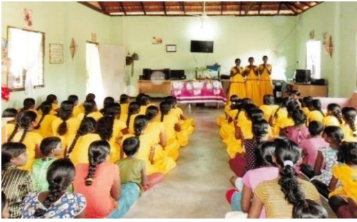
முல்லைத்தீவில் நடைபெற்ற காரைக்கால் அம்மையார் குருபூசை