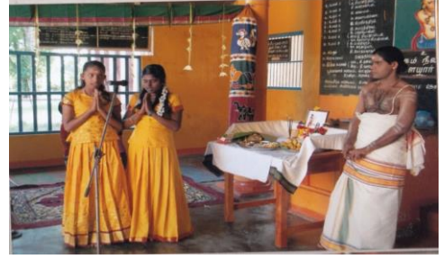
தெல்லிப்பளை நலியம்மன பிள்ளையார் ஆலயத்தில் நடைபெற்ற கண்ணப்ப நாயனார் குருபூசை