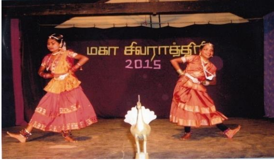
பதுளையில் நடைபெற்ற மகா சிவராத்திரி விழாவில் அறநெறி மாணவர்களால் நிகழ்த்தப்பட்ட