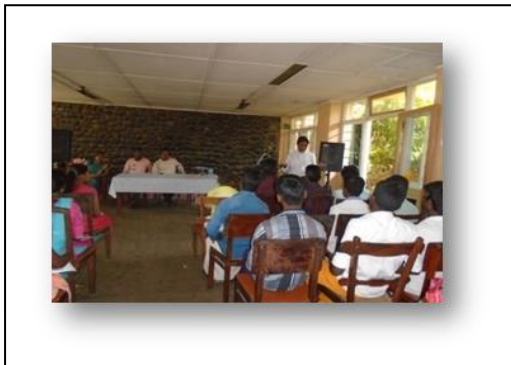
கொழும்பு இராமகிருணமின் மண்டபத்தில் நடைபெற்ற தர்மாசிரியர்களுக்கான வதிவிடக் கருத்தரங்கு