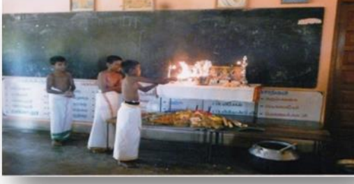
ஆரயம்பதியில் அறநெறி மாணவர்களால் நிகழ்த்தப்பட்ட தைப்பொங்கல் நிகழ்வு