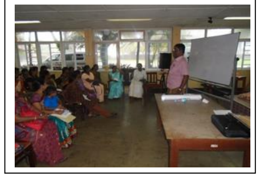
கொழும்பு இராமகிருணமின் மண்டபத்தில் நடைபெற்ற அறநெறி ஆசிரியர்களுக்கான வதிவிட இறுதிநிலைப் பரீட்சைக் கருத்தரங்கு