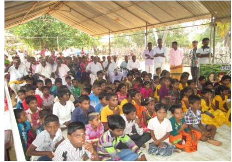
கிளிநொச்சி, பூநகரியில் நடைபெற்ற புண்ணியகிராம நிகழ்வு