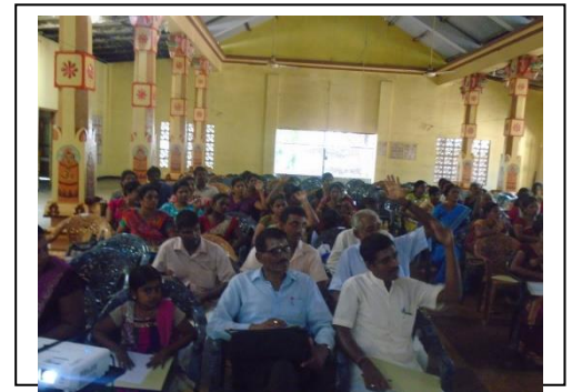
யாழ்ப்பாணத்தில் நடைபெற்ற அறநெறி ஆசிரியர்களுக்கான கருத்தரங்கு