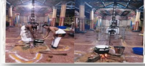
கிளிநொச்சி கந்தசுவாமி கோயிலில் நடைபெற்ற தைப்பொங்கல் நிகழ்வு