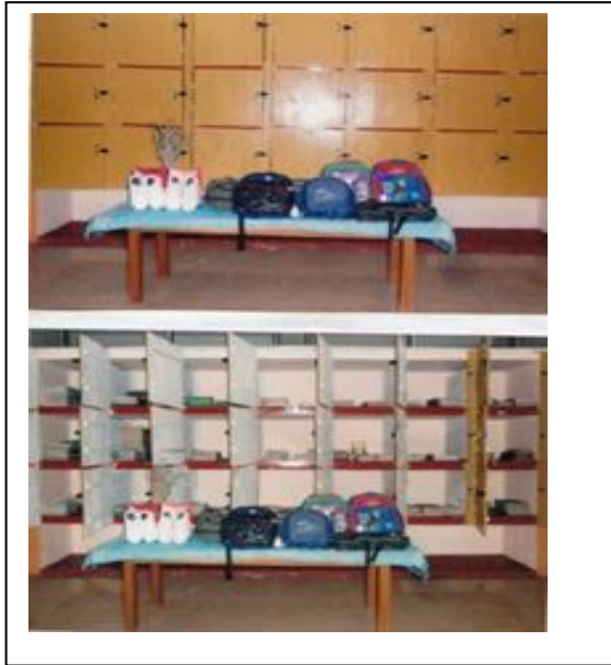
மாத்தளை சாரதா மிஷன் சிறுவர் இல்லத்திற்கான நிதியுதவி