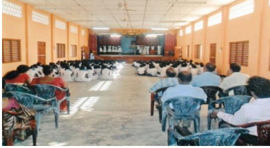
கண்டியில் நடைபெற்ற திருவள்ளூர் குருபூசை