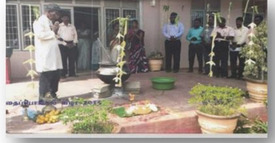
புதுக்குடியிருப்பில் நடைபெற்ற தைப்பொங்கல் நிகழ்வு