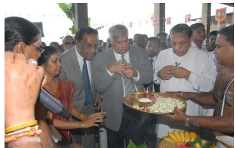
பாராளுமன்றத்தில் கொண்டாடப்பட்ட நவராத்திரி விழா