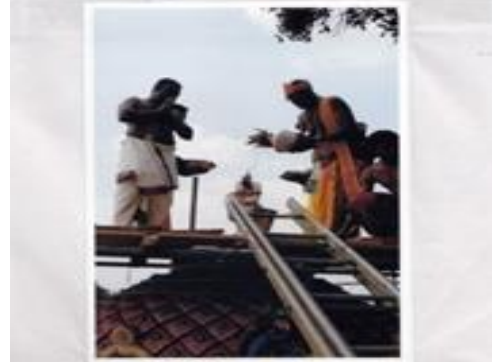
இழுப்பற்கடவை ஸ்ரீ சிவ முத்துமாரியம்மன் ஆலய கும்பாபிஷேக உற்சவம் - மட்டக்களப்பு