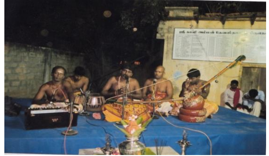
யாழ் திருநெல்வேலி ஸ்ரீ காளி அம்மன ஆலயத்தில் நடைபெற்ற மகா சிவராத்திரி விழாவில் நிகழ்த்தப்பட்ட கலை நிகழ்வு