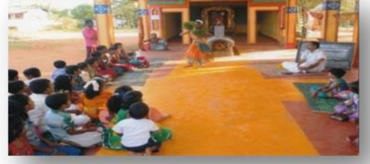
வவுனியா முத்துமாரியம்மன் ஆலயத்தில் நடைபெற்ற தைப்பொங்கல் நிகழ்வு