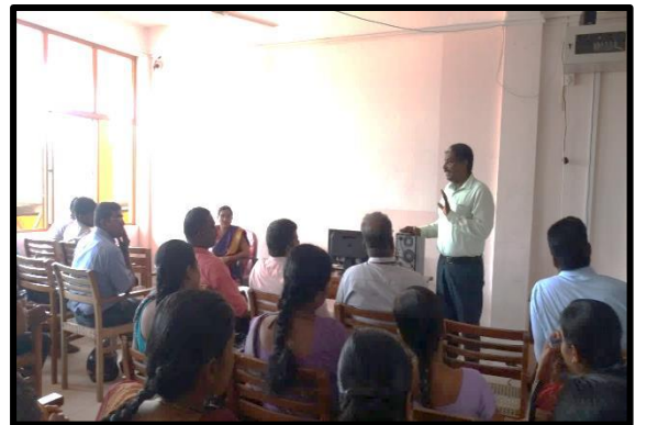
යාපනය ප්‍රාදේශීය හා දිස්ත්‍රික් ලේකම් කාර්යාලයන්හි නිලධාරීන් සඳහා පරිගනක දෘඩාංග පුහුණුව ලබා දීම