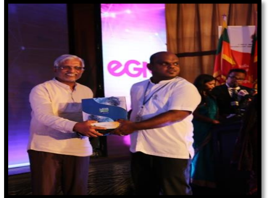
ග්‍රාම නිලධාරීන් සඳහා පරිගනක උපාංග ලබාදීම (2017 මාර්තු 23)