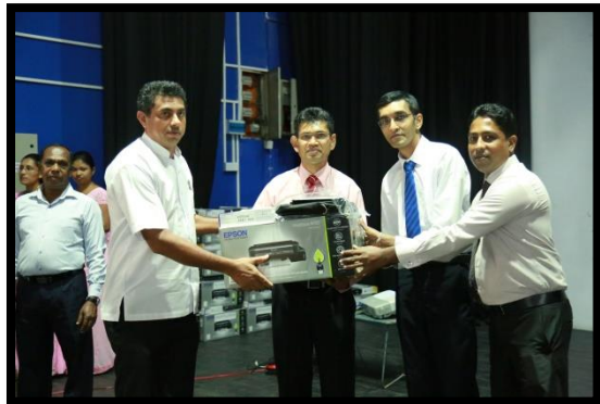
බදුල්ල ප්‍රාදේශීය ලේකම් කොට්ඨාශයේ ග්‍රාම නිලධාරීන් සඳහා පරිගනක උපාංග ලබා දෙමින් (2017.11.06)