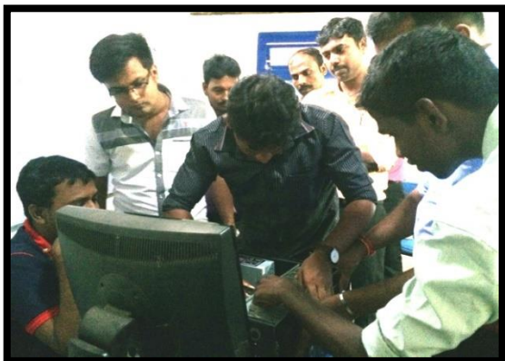
කිලිනොච්චි ප්‍රාදේශීය හා දිස්ත්‍රික් ලේකම් කාර්යාලයන්හි නිලධාරීන් සඳහා පරිගනක දෘඩාංග පුහුණුව ලබාදීම (2017.11.21)