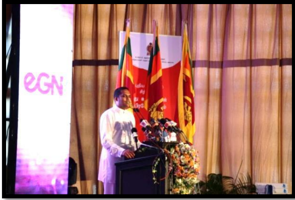
2017.03.23 දින BMICH හිදී පැවති ඉ - ග්‍රාම නිලධාරී නියමු ව්‍යාපෘතිය දියත් කිරීමේ නිල උත්සවය